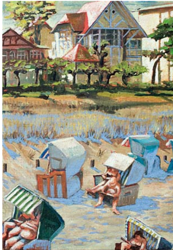
Sigurd Wendland, „Blick vom Rettungsturm, Bansin“, Öl auf Leinwand, 70 x 50 cm

Die jüngste der teilnehmenden Maler wurde 1977 in Berlin geboren. Parallel zur Vorbereitung auf das Abitur begann sie bereits ihr Studium der Bil-