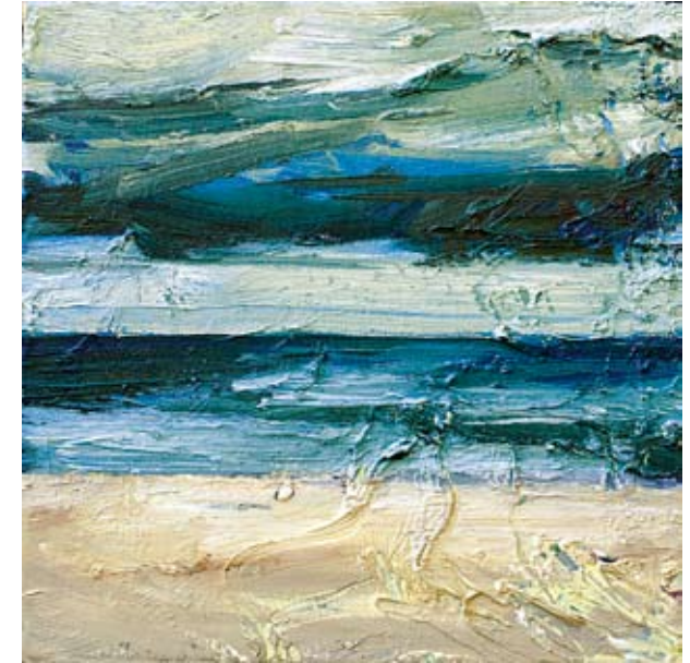
Doris von Klopotek, „Himmel“, Öl auf Nessel, 40 x 40 cm

Der realistische Wilde unter den Landschaftsmalern, geboren 1949, beschäftigt sich oft drastisch und provokant mit aktuellen gesellschaftlichen Entwicklungen. Das Menschliche ist bei ihm nackt, krude, fast lächerlich. In herausfordernden Metaphern zieht er schonungslos Bilanz der menschlichen Gegenwart. Das hindert den Vorsitzenden des Vereins Berliner Künstler nicht daran, in einer Landschaft wie der Usedom gemeinsam mit Kollegen Stille und Frieden der Natur zu finden. Der viel gereiste Quer- und Vordenker, der seine Ateliers schon an den verschiedensten Orten in Europa eröffnete, ist der Ideengeber des Projekts „7 malen am Meer“.