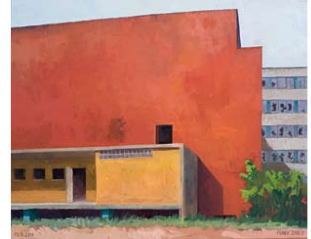
Frank Suplie, „Erich-Weinert-Kasten“, Eitempera auf Leinwand, 50 x 60 cm