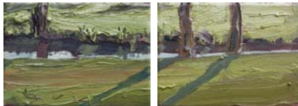
Lars Möller, „Bach mit Bäumen“, Öl auf Leinwand, je 13 x 18 cm

Zur Ausstellung erscheint ein umfangreicher Katalog.