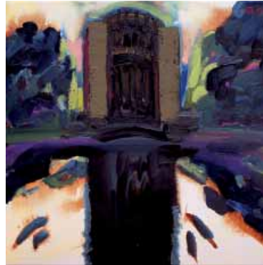
„Hamburg. Sternwarte“, 2006, Öl auf Leinwand, 40 x 40 cm