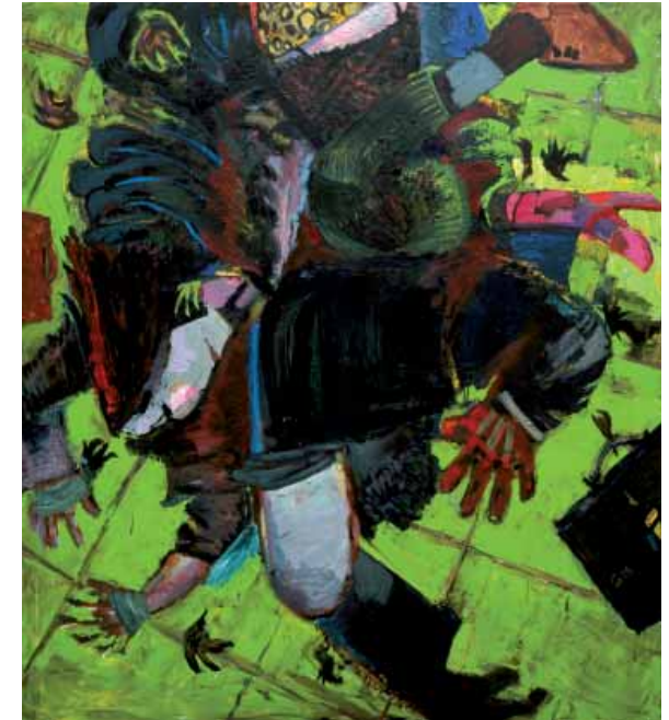
„Wintersturz“, 2006, Öl auf Leinwand, 180 x 160 cm

Eröffnung am Donnerstag, dem 21. September 2006 um 19 Uhr in Anwesenheit des Künstlers. Es spricht Dr. Katrin Arrieta.