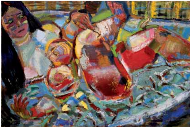
„Das Bad“, 2006, Öl auf Leinwand, 120 x 180 cm

Abbildung außen: „Die Magd“, 2006, Öl auf Leinwand, 180 x 160 cm (Ausschnitt)