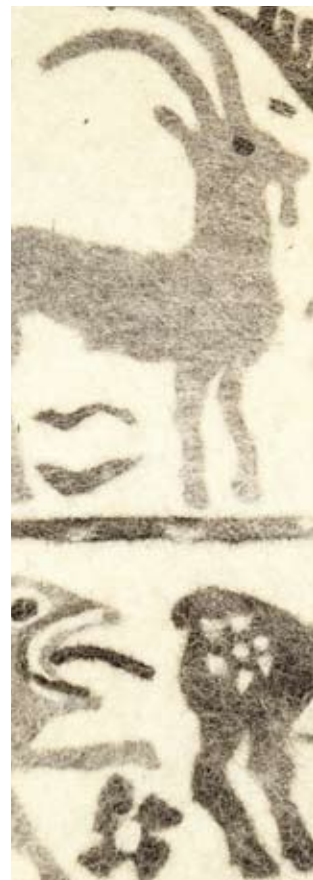
Archaik IV 2008, Filz, 85 x 195 cm (Detail)