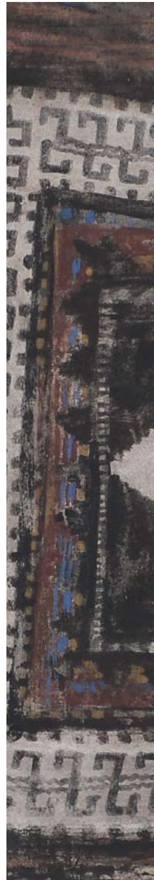
Großmutter XXX 2008, Tempera, 27 x 18 cm (Detail)