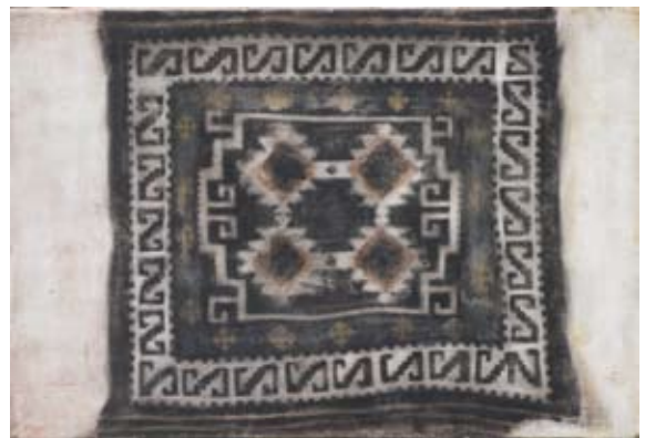
oben links: Großmutter XXIX . 2008, Tempera, 18 x 27 cm oben rechts: Großmutter XXVIII . 2008, Tempera, 18 x 27 cm unten links: Großmutter XXX . 2008, Tempera, 18 x 27 cm unten rechts: Großmutter XXXIII . 2008, Tempera, 18 x 27 cm