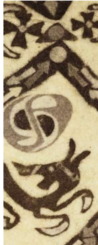
Archaik V 2008, Filz, 195 x 110 cm (Detail)

seit 1988 zahlreiche Ausstellungen seiner Bilder im In- und Ausland (u.a. in Berlin mit dem Bildhauer Hans Scheib)