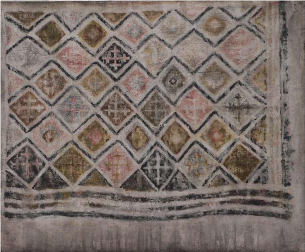
Großmutter XXVII. 2008, Tempera, 50 x 60 cm