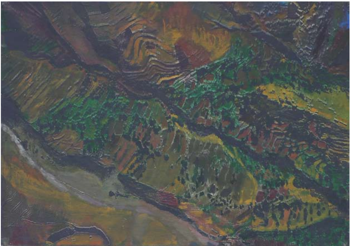
Vogelperspektive V. 2007, Mischtechnik/Papier/Leinwand, 70 x 99 cm