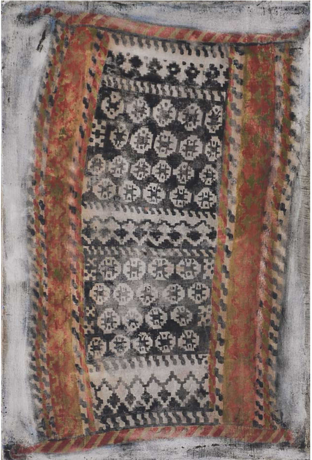
Großmutter XXXI. 2008, Tempera, 27 x 18 cm