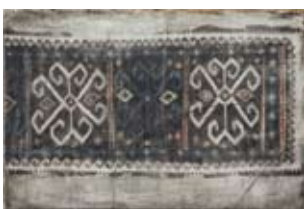
Großmutter XXXV 2008, Tempera, 23 x 35 cm

Georgien, dieses historische Land am Südhang des Kaukasus, an den einst ein frecher, seinen Göttern Feuer entwendet habender Krimineller geschmiedet wurde, lag seit 65 v. Christus in der Krallen Roms und galt schon 350 Jahre später als christianisiert. Im 7. Jahrhundert geriet es unter die Herrschaft der Araber, ohne sich allerdings wie andere Länder, denen es ähnlich erging, muslimisieren zu lassen. Dazu gehört Charakter, der dieses Volk, das aus vielen Völkerschaften besteht, auch über die kommenden Jahrhunderte hinweg auszeichnen sollte.