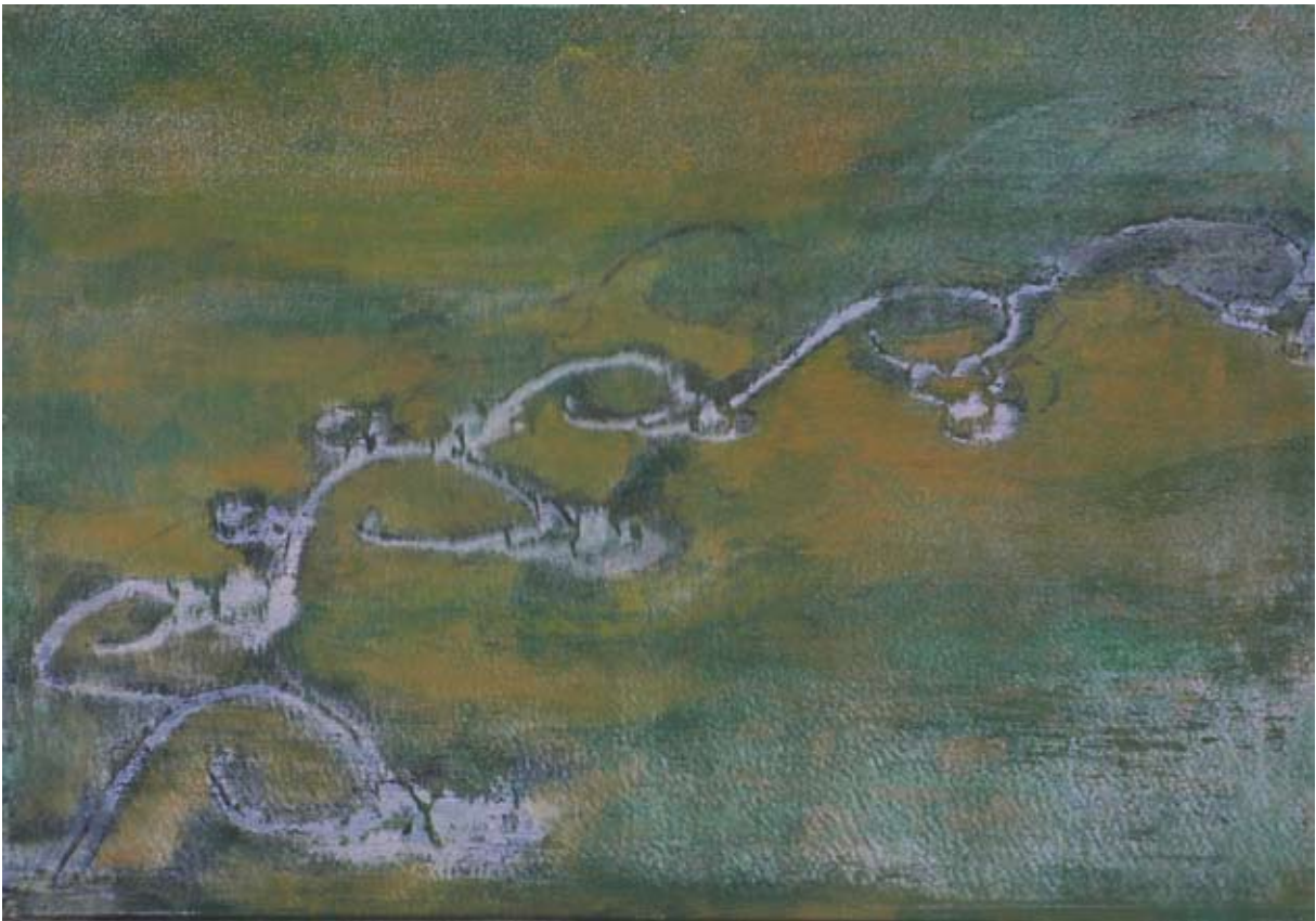
Vogelperspektive IX. 2007, Mischtechnik/Papier/Leinwand, 70 x 99 cm