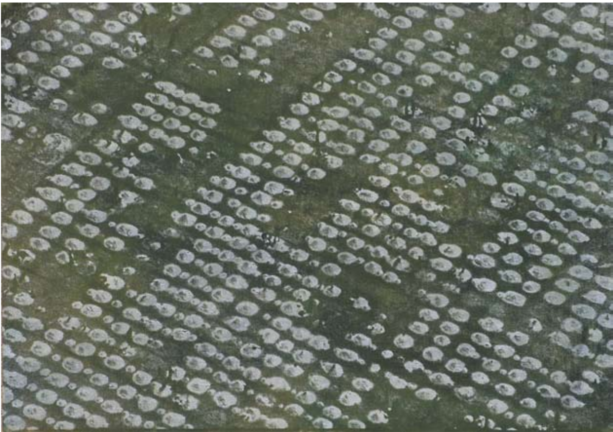
Vogelperspektive VIII. 2007, Mischtechnik/Papier/Leinwand, 70 x 99 cm