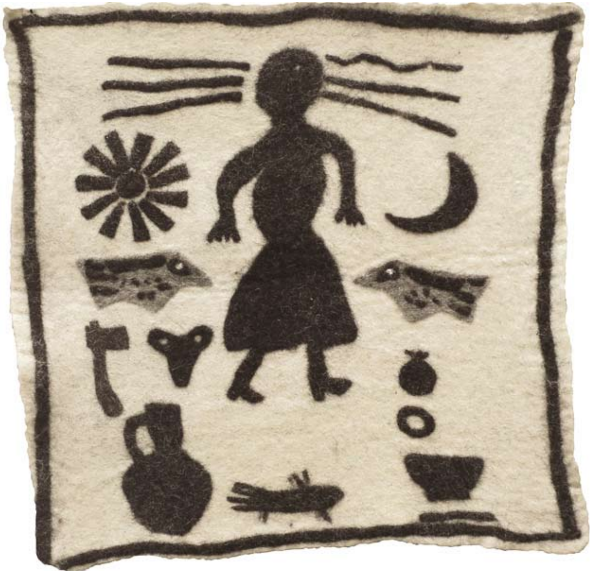
oben: Archaik I. 2007, Filz, 70 x 196 cm unten: Archaik III. 2007, Filz, 70 x 70 cm