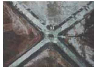
Vogelperspektive VI 2007, Mischtechnik, 61 x 85 cm