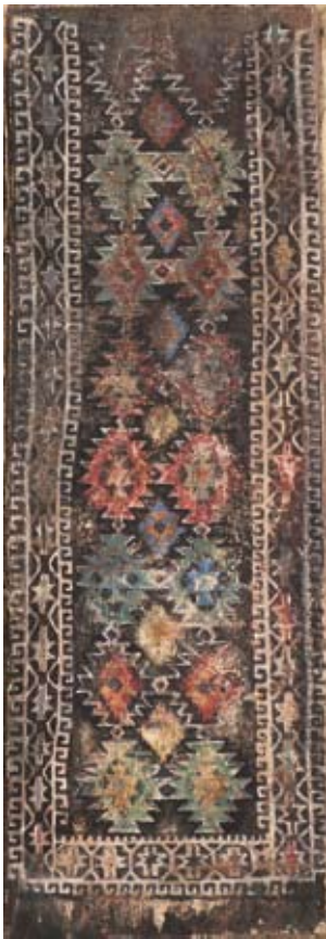
Großmutter XXXIV 2008, Tempera, 40 x 14 cm