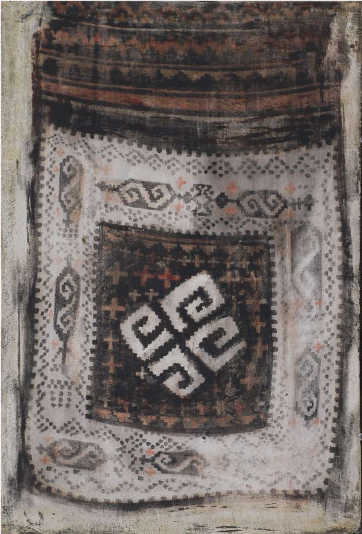
Großmutter XXXII. 2008, Tempera, 27 x 18 cm