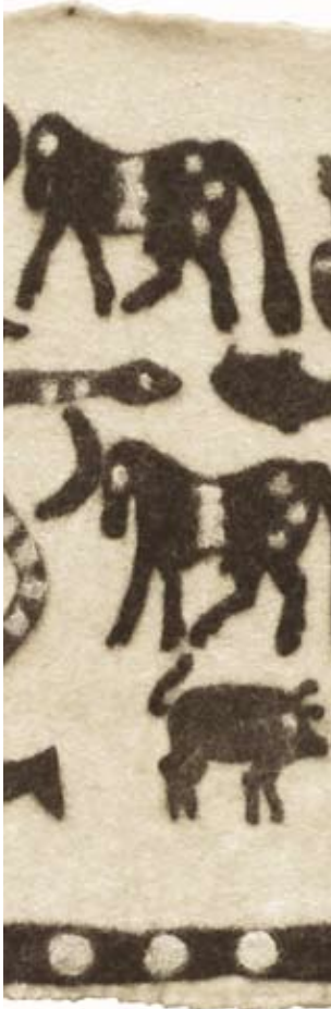
Archaik I 2007, Filz, 70 x 196 cm (Detail)