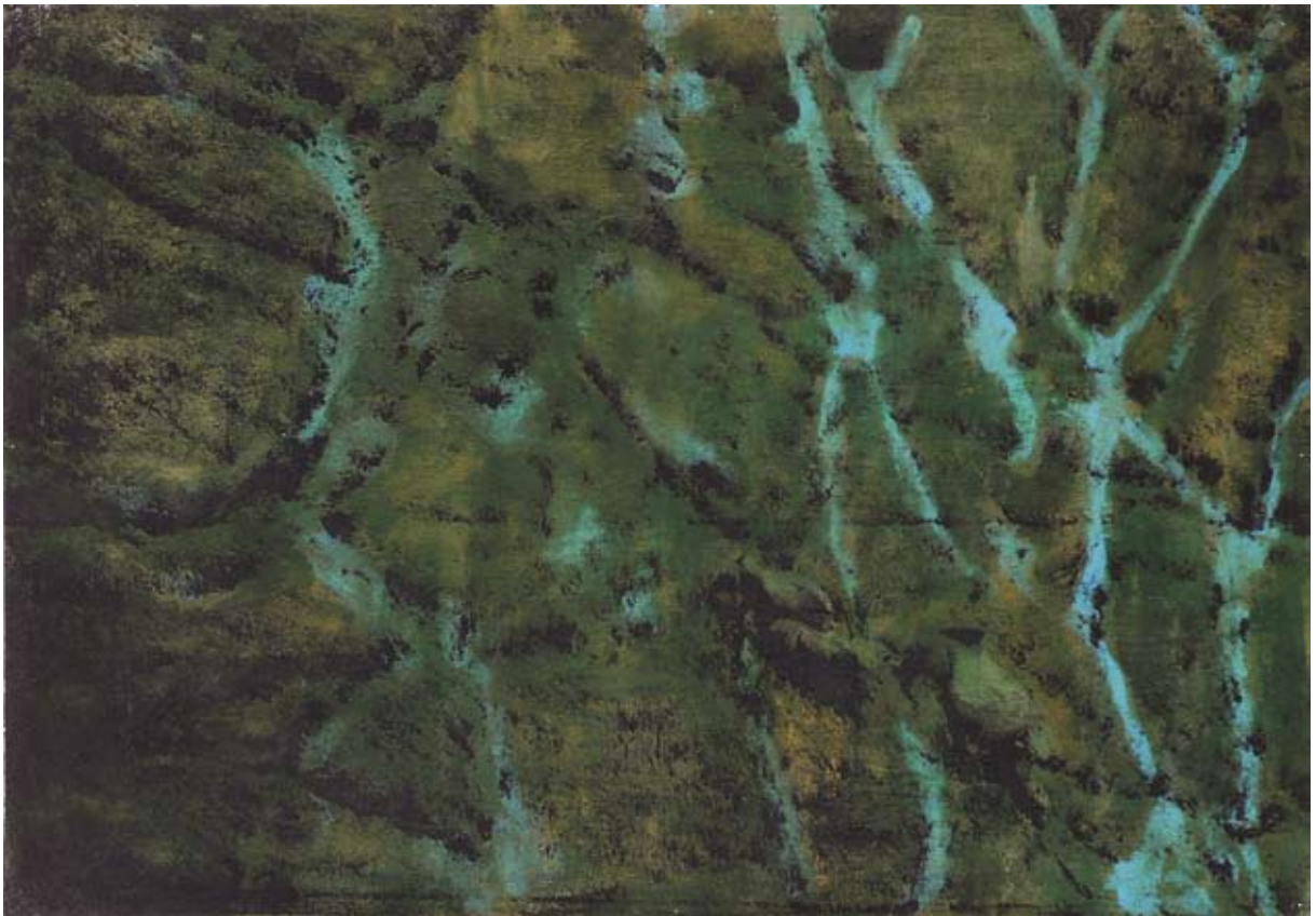
Vogelperspektive XI. 2007, Mischtechnik/Papier/Leinwand, 70 x 99 cm vorige Seite: Vogelperspektive IV. 2007, Mischtechnik/Papier/Leinwand, 150 x 160 cm (Detail)