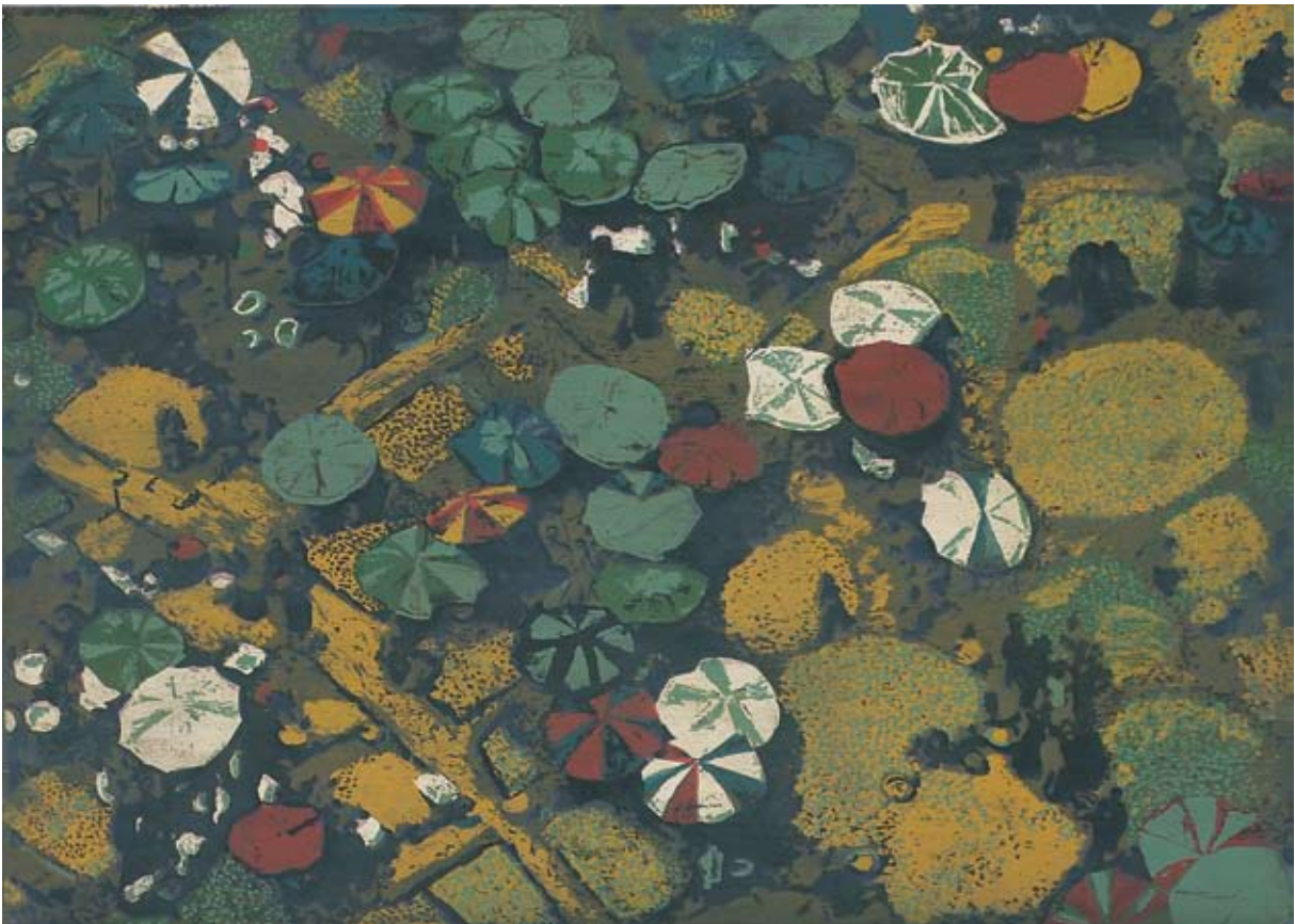
Vogelperspektive II. 2007, Mischtechnik/Papier/Leinwand, 61 x 85 cm