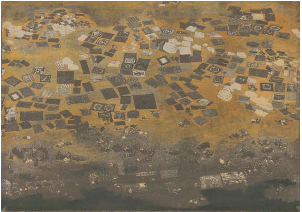
Vogelperspektive VII. 2007, Mischtechnik/Papier/Leinwand, 70 x 99 cm