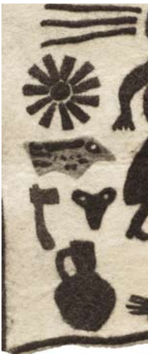
Archaik III 2007, Filz, 70 x 70 cm (Detail)

als junger Mensch beim Schafehüten das Zeichnen entdeckte, wollte lieber studieren. Er absolvierte die Nikoladse-Kunsthochschule in Tbilissi und die dortige Staatliche Akademie der Künste. Seit 1994 leitet er die alljährlichen Kulturtag „Gwinobissa“ und ist inzwischen, nach zehnjähriger Vizepräsidentschaft, Präsident der rührigen Georgisch-Deutschen Gesellschaft, die vor allem georgische Kultur vermittelt. Man organisiert Künstler-Reisen oder Schriftsteller-Treffen. Das mit einer Ausstellung verbundene Projekt „Begegnung mit Pirosmi“ im Oktober 2006, an dem internationale, hauptsächlich renommierte Künstler des in Berlin jeden Montag tagenden sogenannten Obermaier-Stammtisch teilnahmen, fand viel Beachtung. Nicht vergessen sei, daß Gocha Gulelauri seit 1994 als Bühnenbildner und Produzent am Kellertheater Tbilissi wirkt.