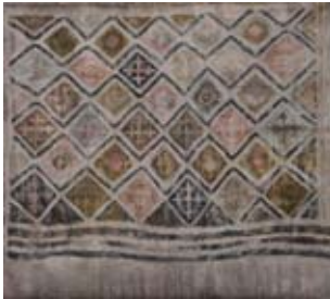
Großmutter XXVII 2007, Tempera, 50 x 60 cm