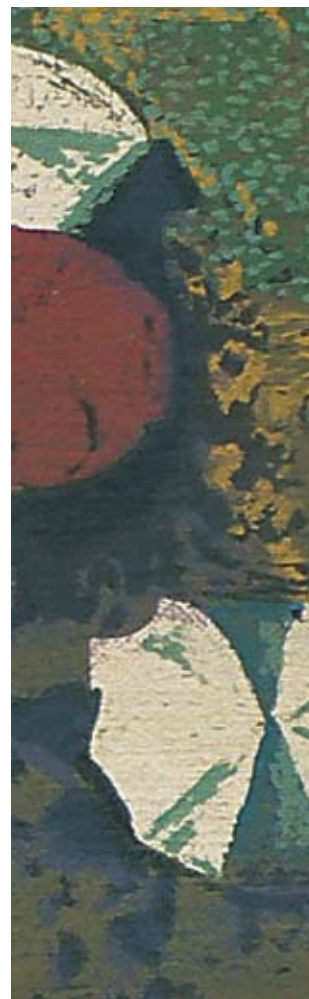
Vogelperspektive II 2007, Mischtechnik, 61 x 85 cm (Detail)