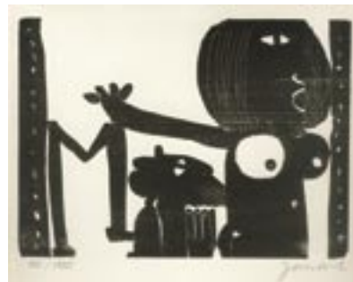
Janosch Der März

Galerie Rose Dienstag – Freitag 11 – 18 Uhr Samstag 10 – 14 Uhr Großer Burstah 36 20457 Hamburg Telefon 040 – 36 56 36, Fax: 040 – 37 81 79 www.galerierose.com, info@galerierose.com