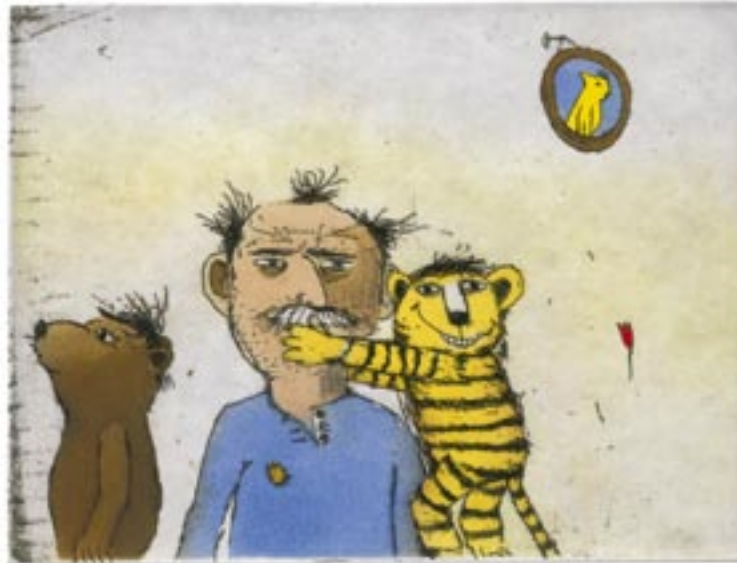
Janosch, Des Künstlers wahres Gesicht, 2005