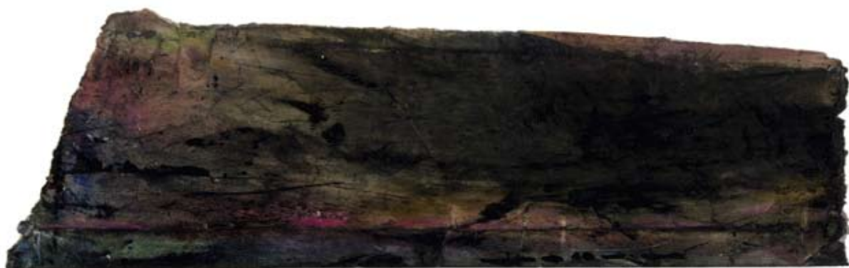
Zwielicht. 2008, Wasserfarbe auf Ölpapier, 15 x 32 cm