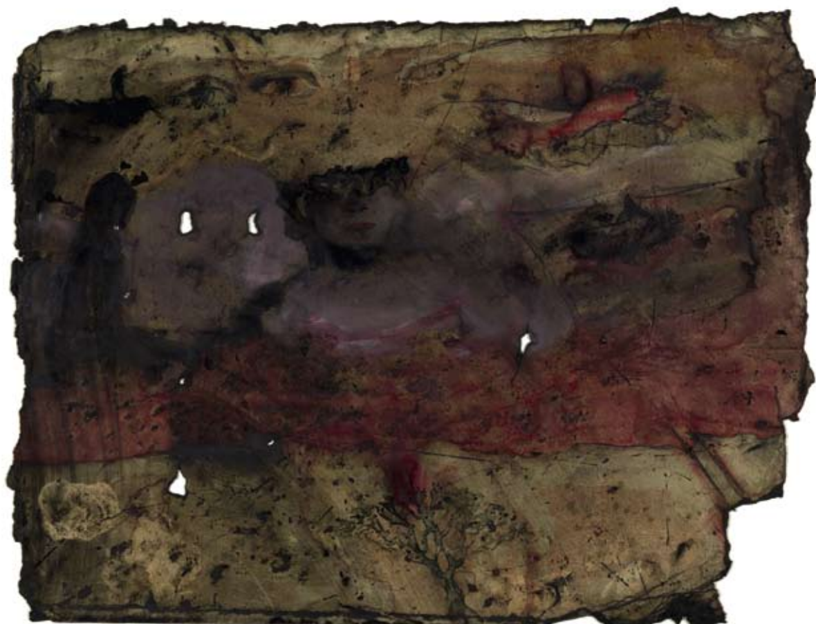
Die japanische Nacht. 2008, Wasserfarben auf Ölpapier, 25,5 x 32 cm