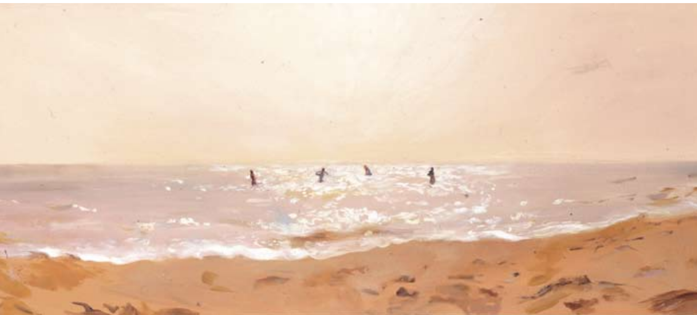
Champagner am Weststrand. 2003/2008, Öl auf Leinwand, 50 x 210 cm