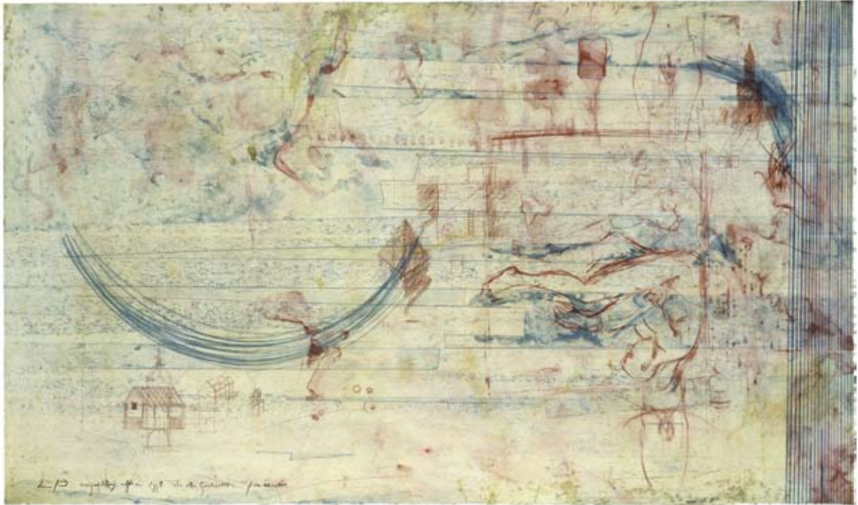
Die alte Geschichte. 1998/1999, Radierung, 113 x 148 cm