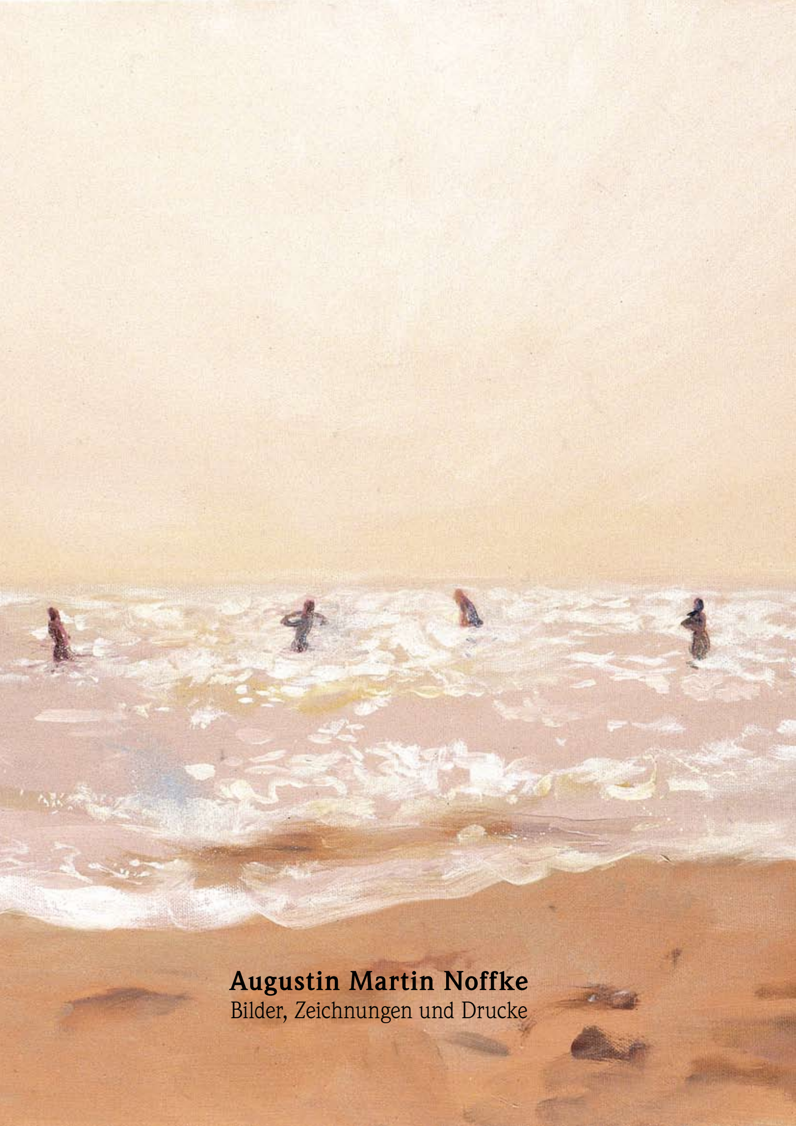
Augustin Martin Noffke Bilder, Zeichnungen und Drucke