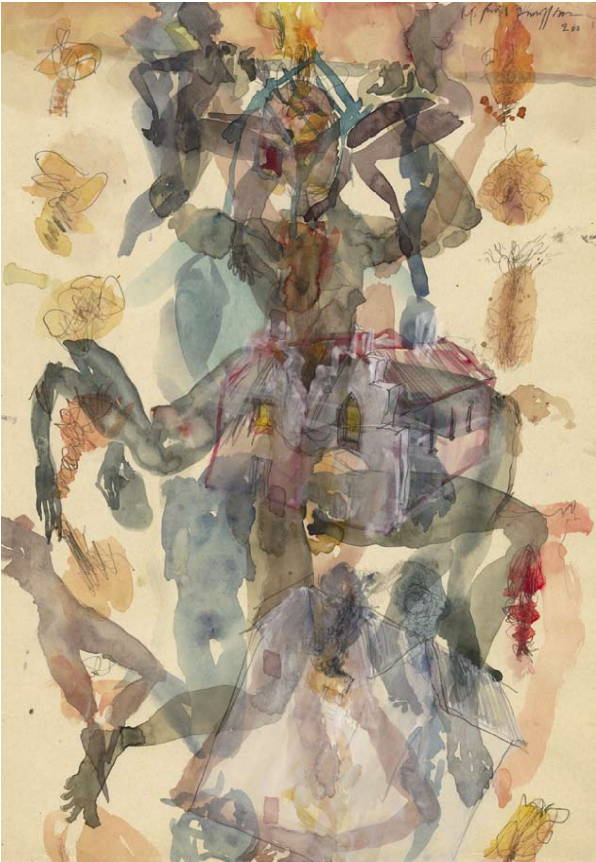
Batailles Frühstück. 2008, Wasserfarbe, 42 x 30 cm