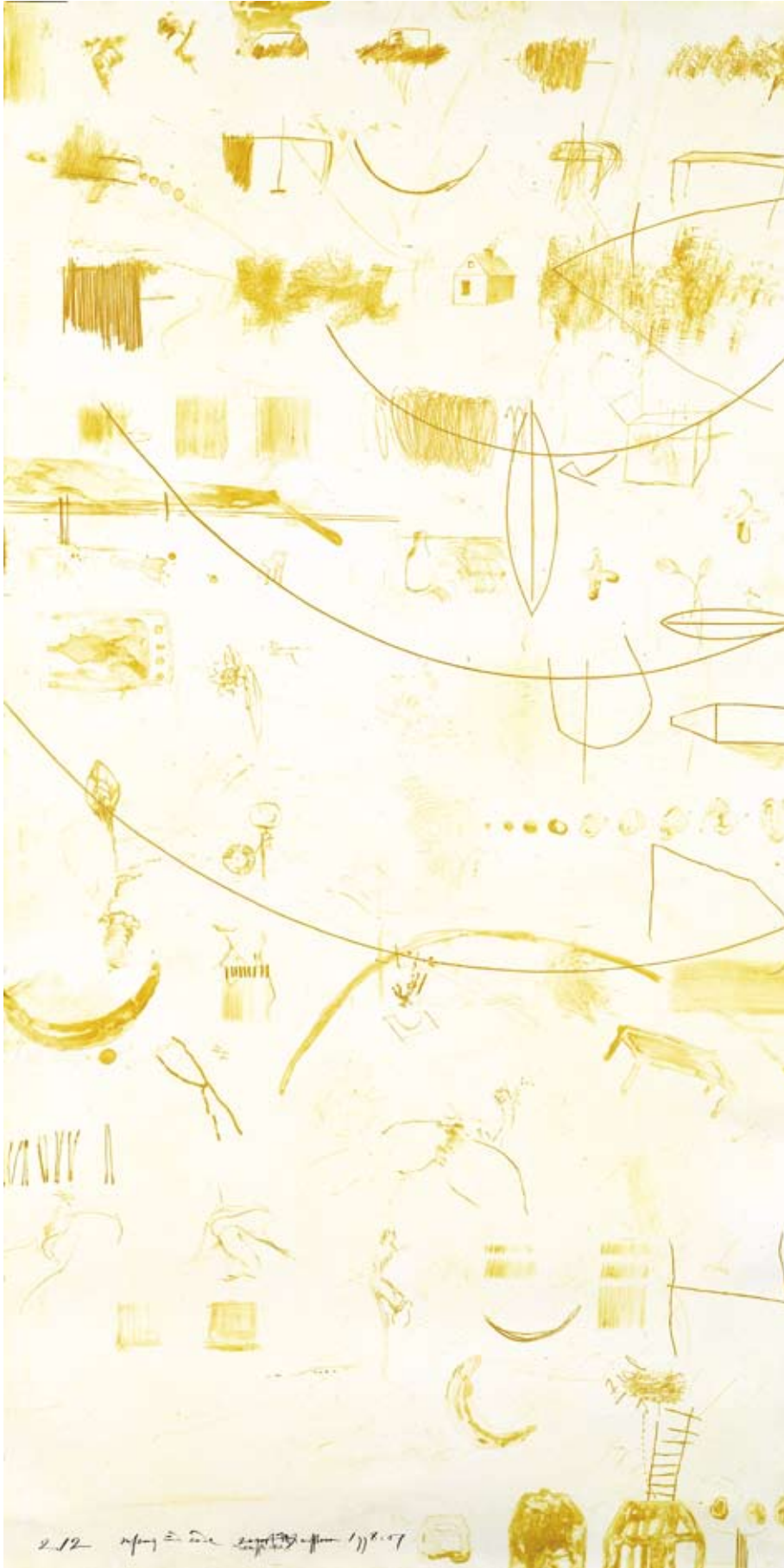
Anfang und Ende. 1998/1999, Radierung, 207 x 113 cm