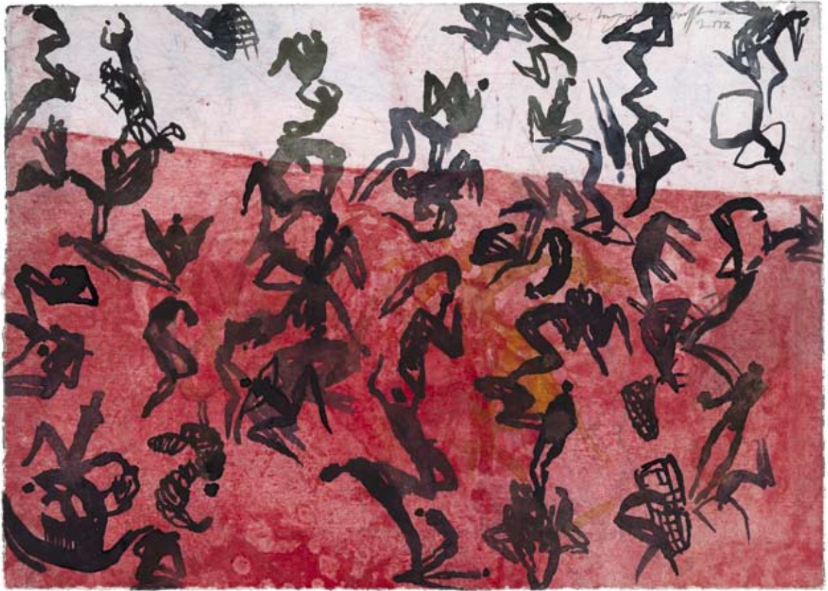
Kaskade. 2008, Wasserfarben auf Radierung, 29 x 31 cm