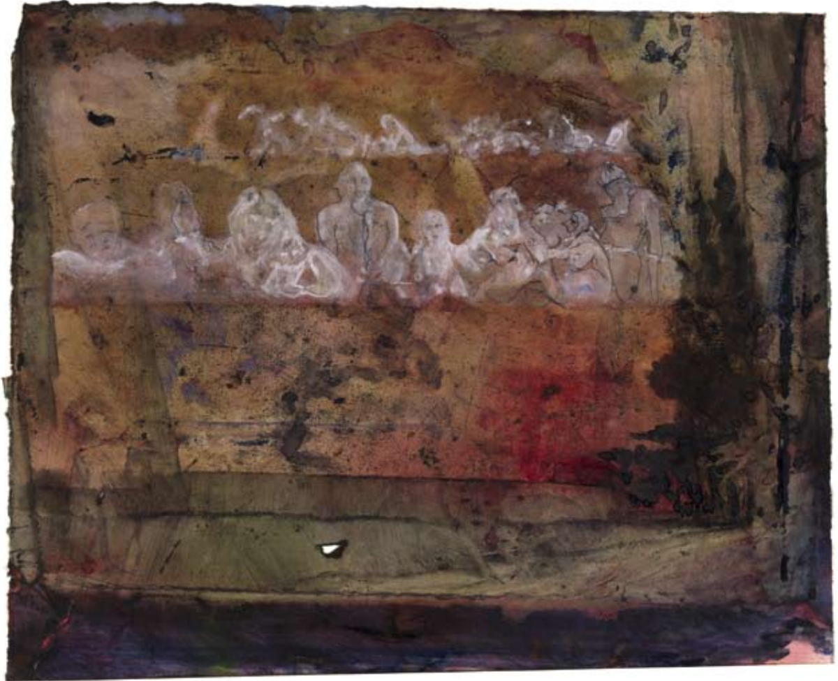
Abendmahl. 2008, Wasserfarben auf Ölpapier, 28 x 34 cm