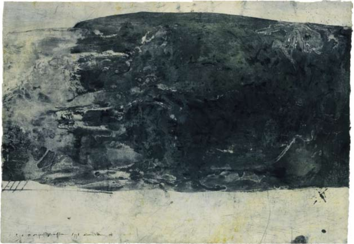
Schwere Wolke. 1998/1999, Radierung, 113 x 128 cm