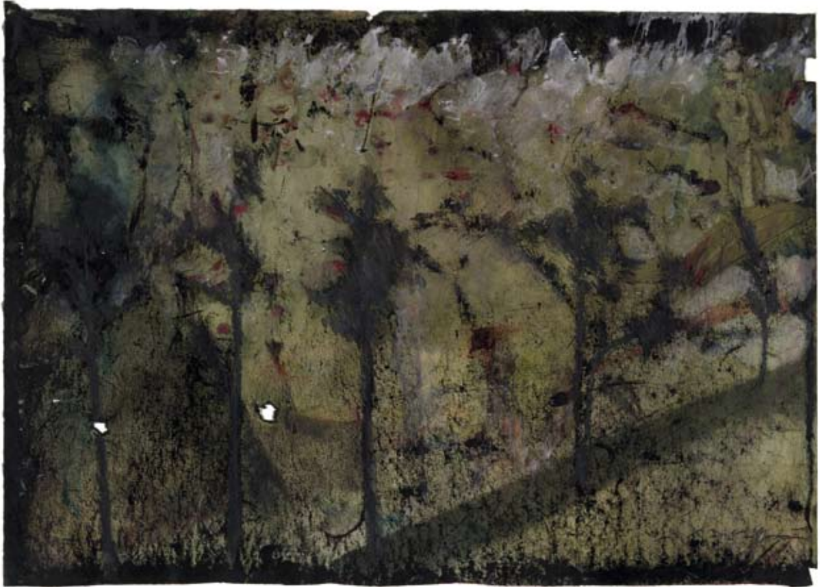
Prozession II. 2008, Wasserfarben auf Ölpapier, 35 x 46 cm