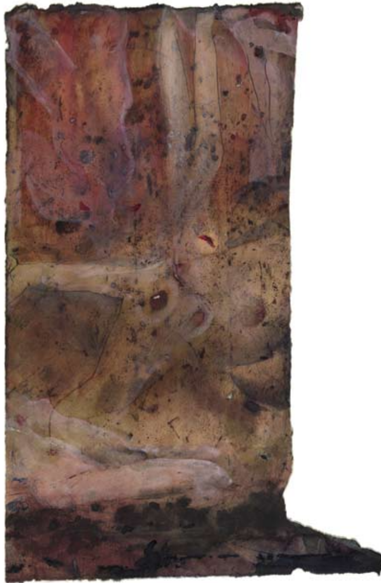
Dunstedter Brook. 2008, Wasserfarben auf Ölpapier, 33 x 24 cm: