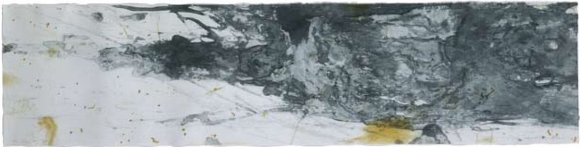
Himmel. 1999, Radierung, 47 x 177 cm Himmelland. 1998/1999, Radierung, 47 x 194 cm