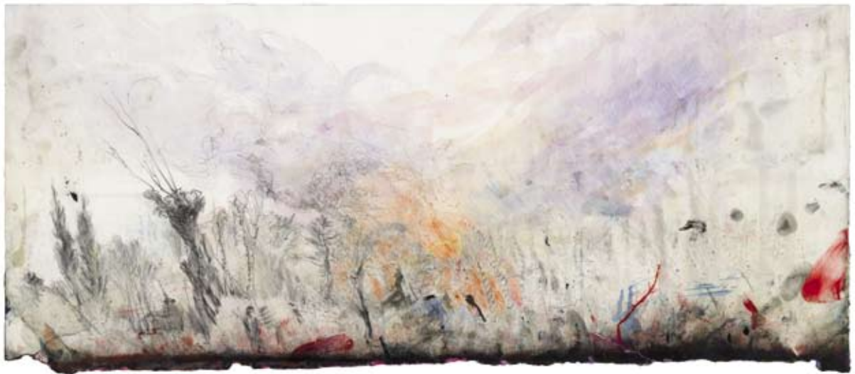
Im Nebel. 2007/2008, Mischtechnik, 23 x 52 cm