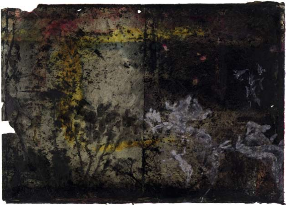
Arcadia. 2008, Wasserfarbe auf Ölpapier, 36 x 47 cm