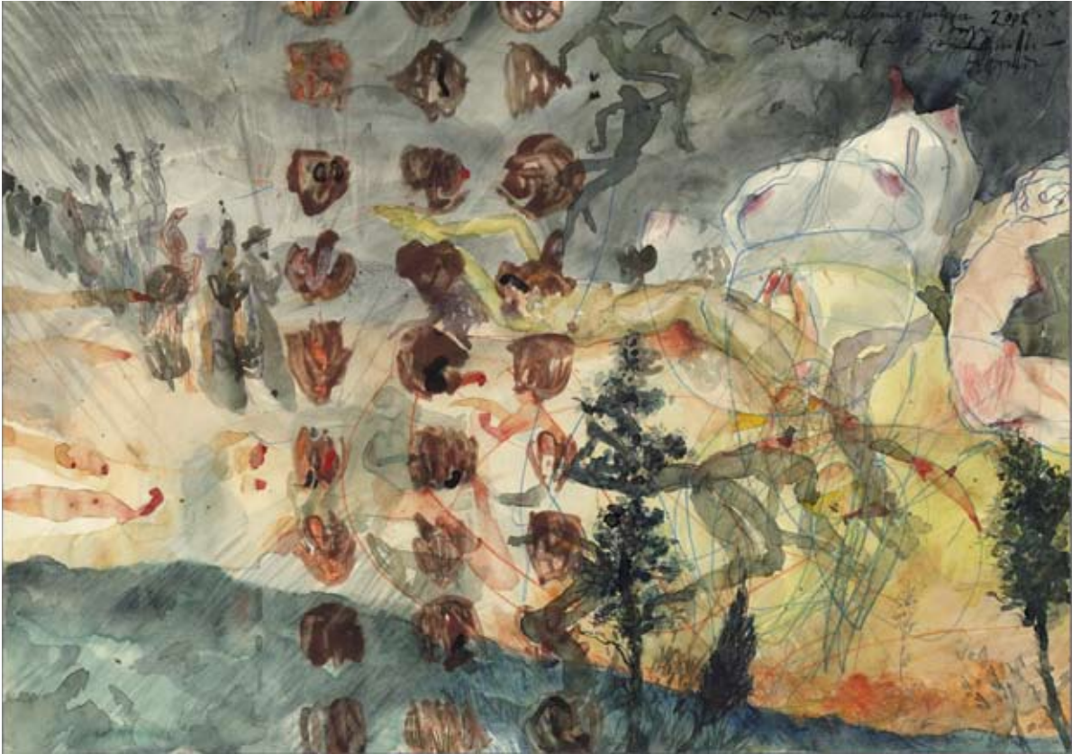
Prozession I. 2008, Wasserfarbe, 29,5 x 41,5 cm