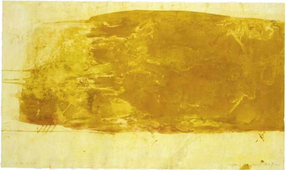
Wolke. 1998/1999, Radierung, 113 x 148 cm